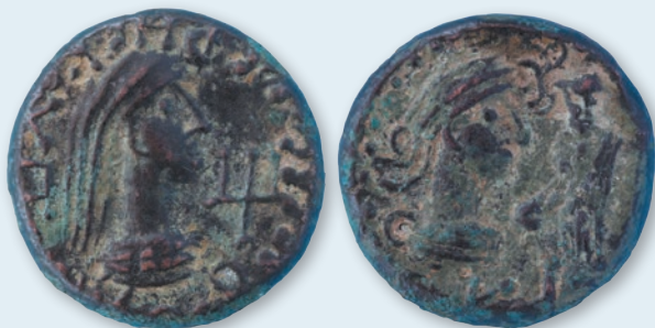
6. Мідна монета Рескупоріда V