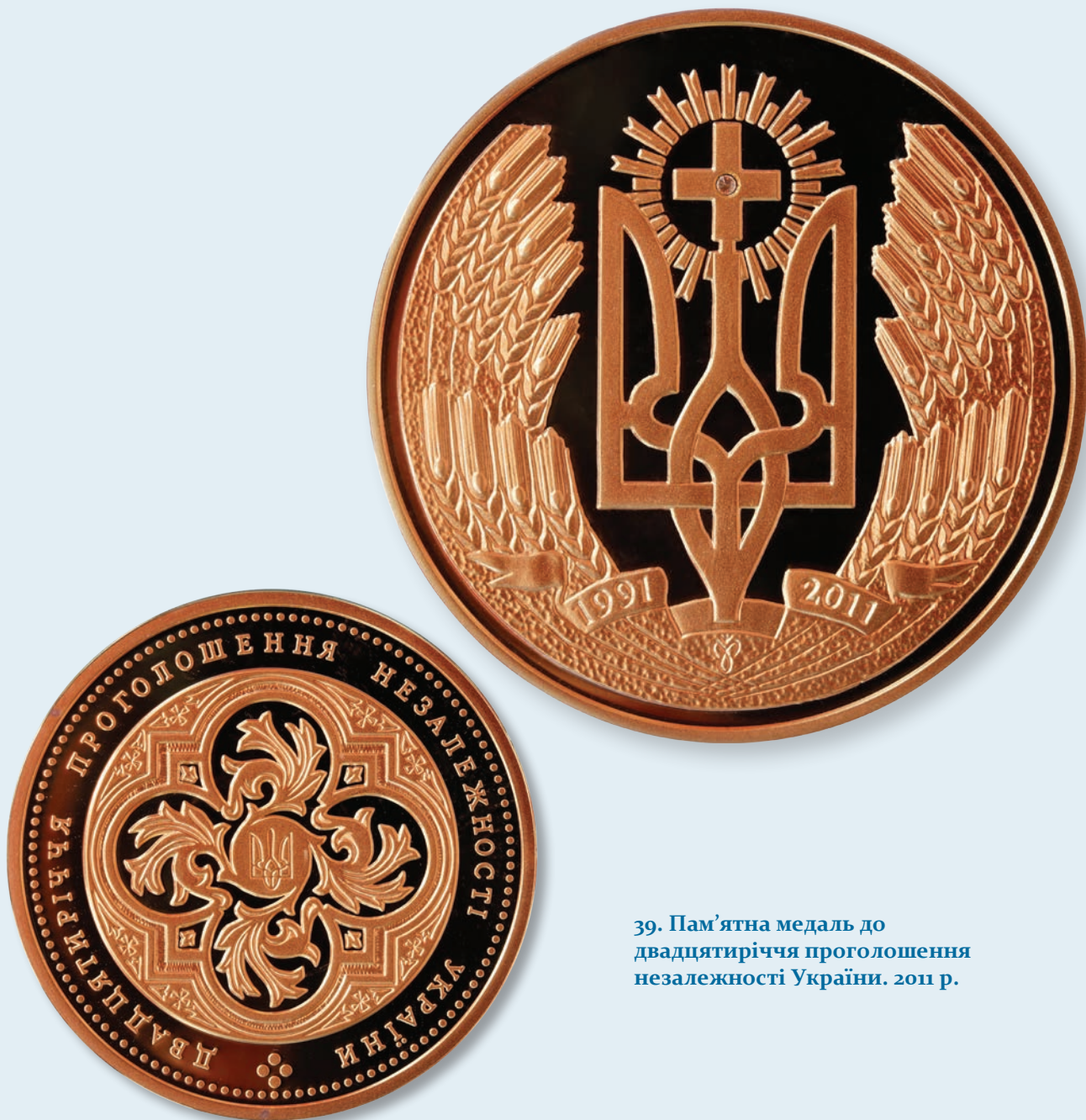
39. Пам'ятна медаль до двадцятиріччя проголошення незалежності України. 2011 р.