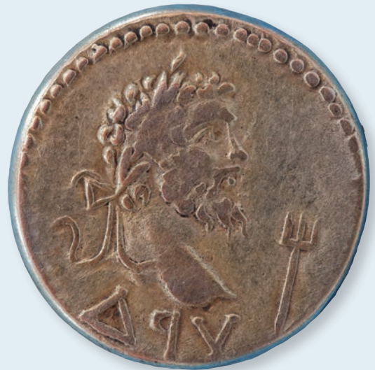
2. Статер Савромата II