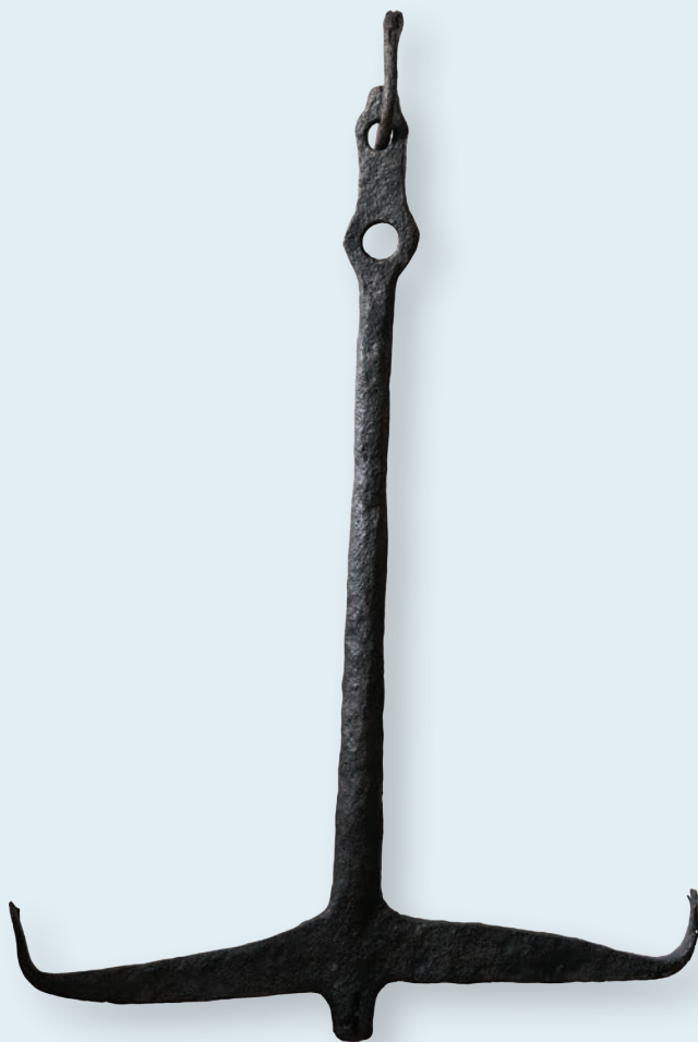
7. Якір дворогий корабельний V – VII ст.