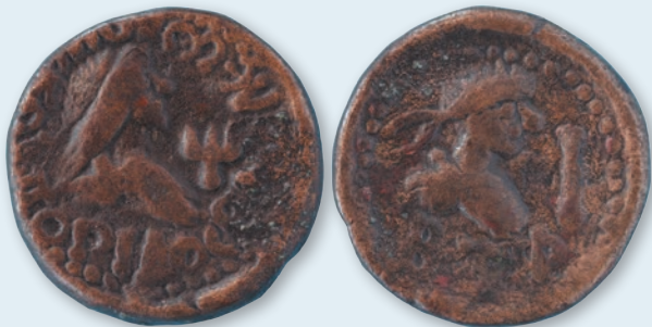
5. Мідна монета Рескупоріда IV