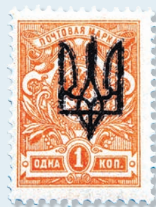
30. Марка поштова пошти Російської імперії, номінал 1 копійка з надруком українського герба тризуба