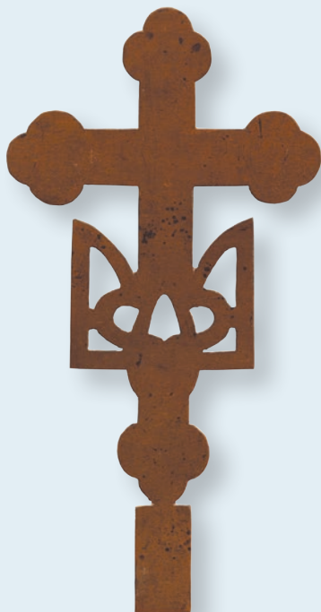
35. Гребний хрест на тризубі