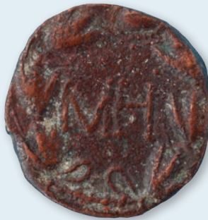
1. Сестерцій Реметалка