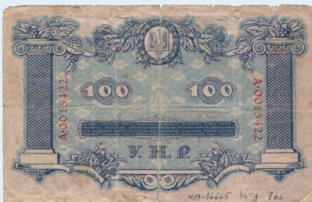
31. Грошова купюра номіналом 100 гривень