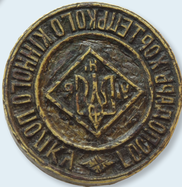
22. Печатка Олександрівської державної української гімназії