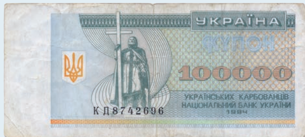
37. Купон номіналом 100 000 українських карбованців