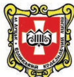
Комунальний заклад «Волинський обласний краєзнавчий музей» Волинської обласної ради, м. Луцьк