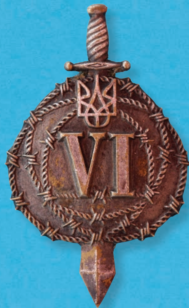
24. Відзнака 6-ї Січової стрілецької піхотної дивізії армії УНР