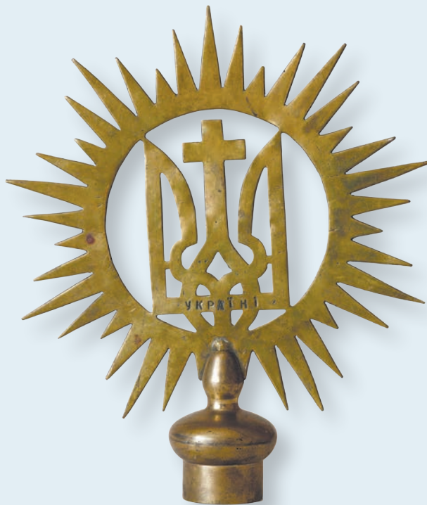
36. Навершя на прапор у вигляді тризуба