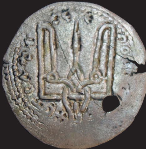
10. Срібляник IV типу