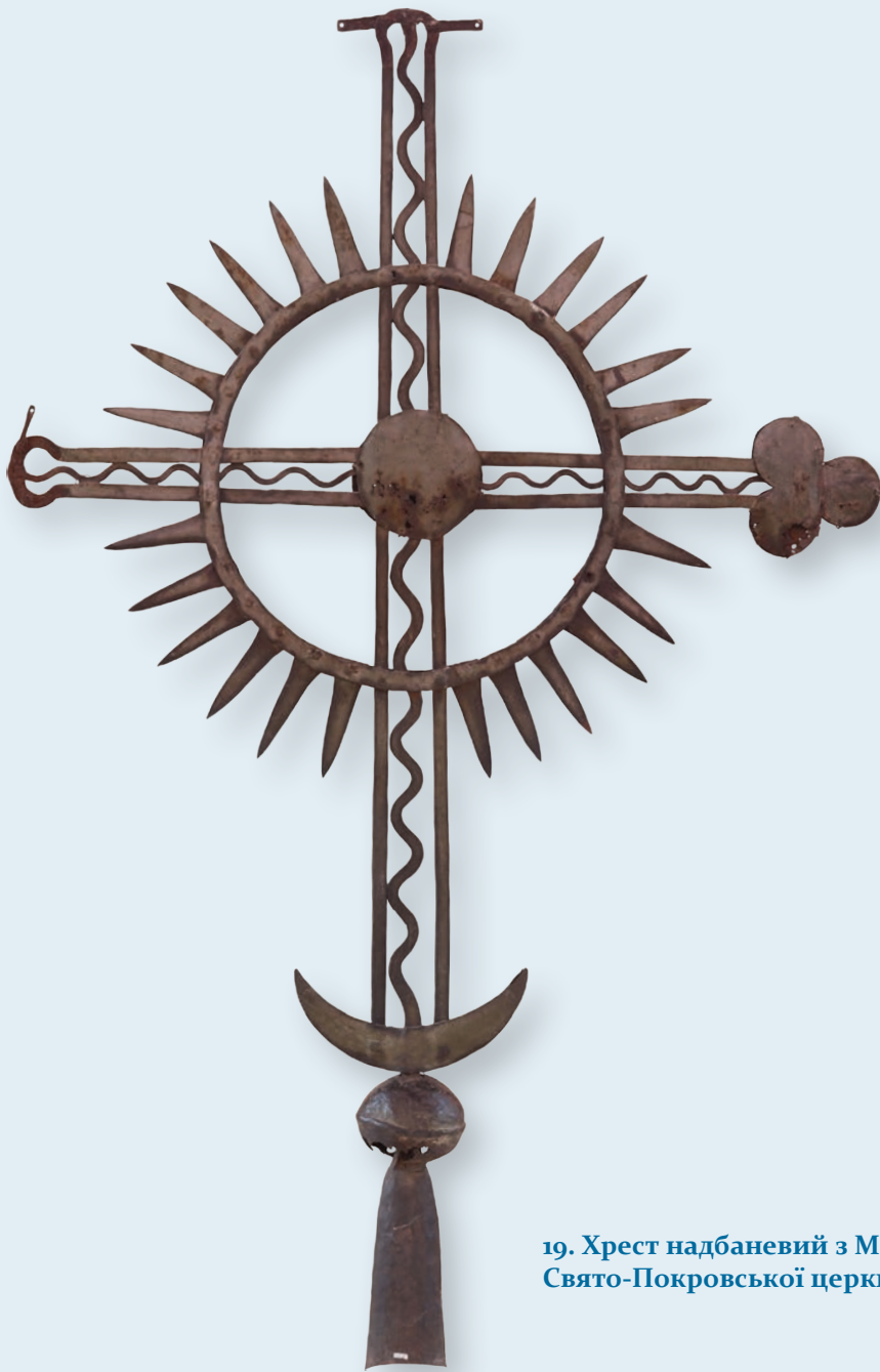
19. Хрест надбаневий з Микитинської Січової Свято-Покровської церкви