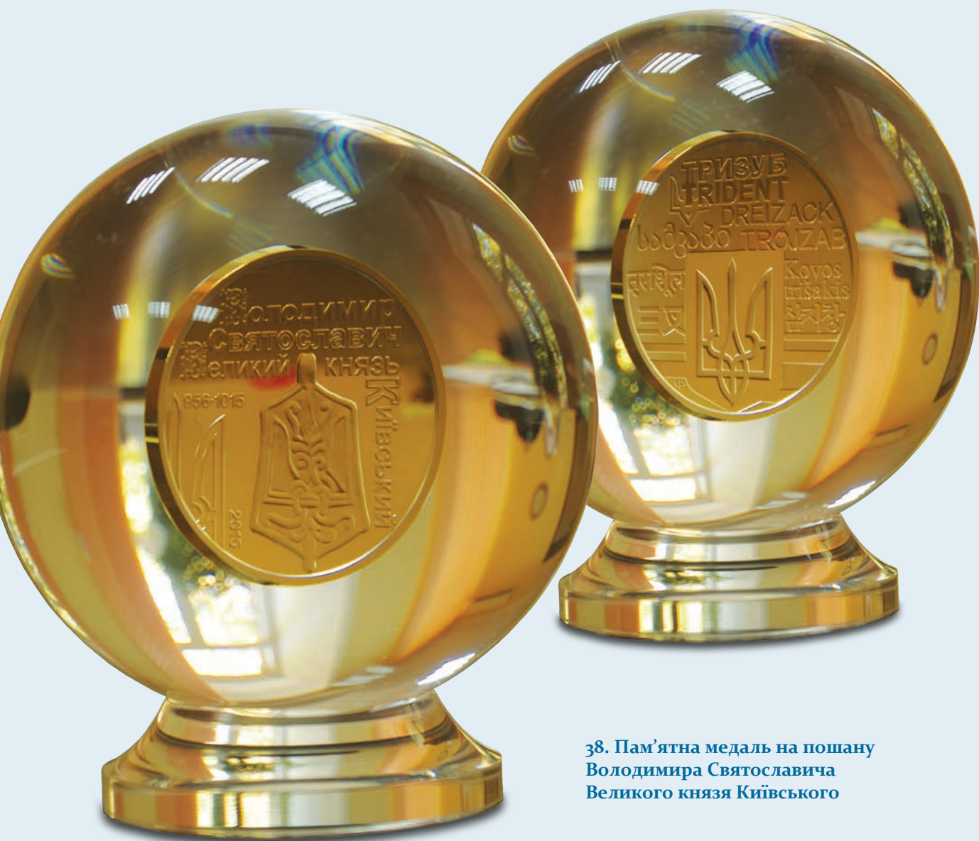
38. Пам'ятна медаль на пошану Володимира Святославича Великого князя Київського