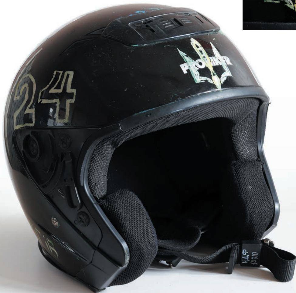
40. Шолом з тризубом учасника Революції Гідності, 2014 р.