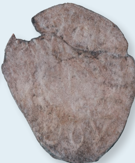
16. Монета II типу князя Володимира Ольгердовича