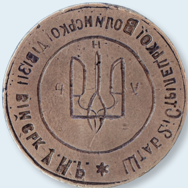
20. Печатка Штабу Другої Стрілецької дивізії УНР