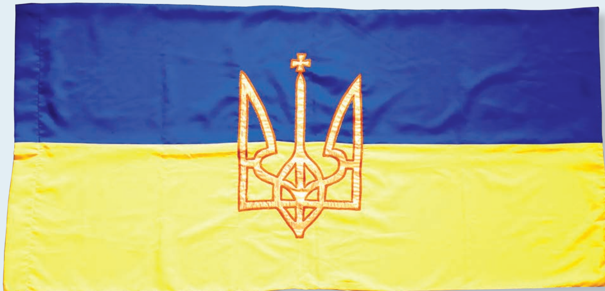
27. Прапор Української держави періоду Гетьманату