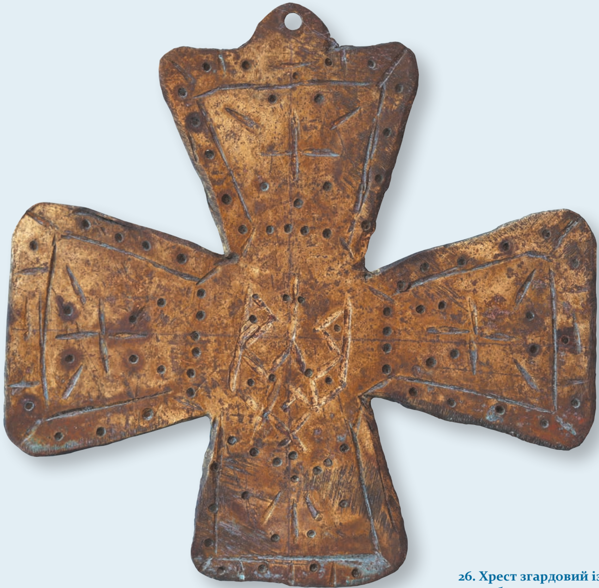
26. Хрест згардовий із тризубом