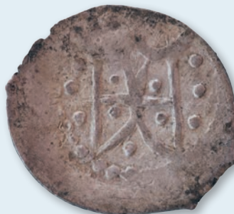
17. Монета II типу Володимира Ольгердовича