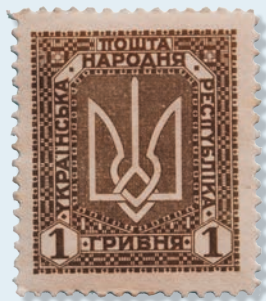
28. Марка поштова пошти УНР, номінал 1 гривня