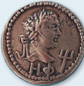
3. Статер Рескупоріда II 211/2 р.