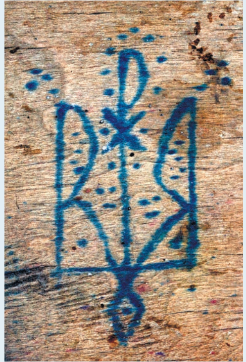
34. Графіті тризуба з хрідною із Запоріжжя