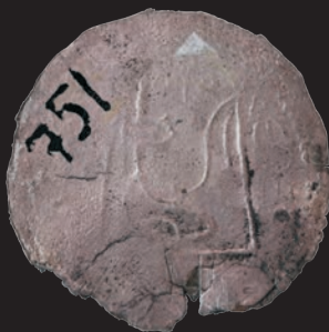
11. Срібляник князя Святополка