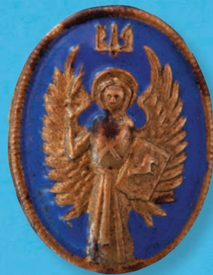
25. Кокарда військ УГА