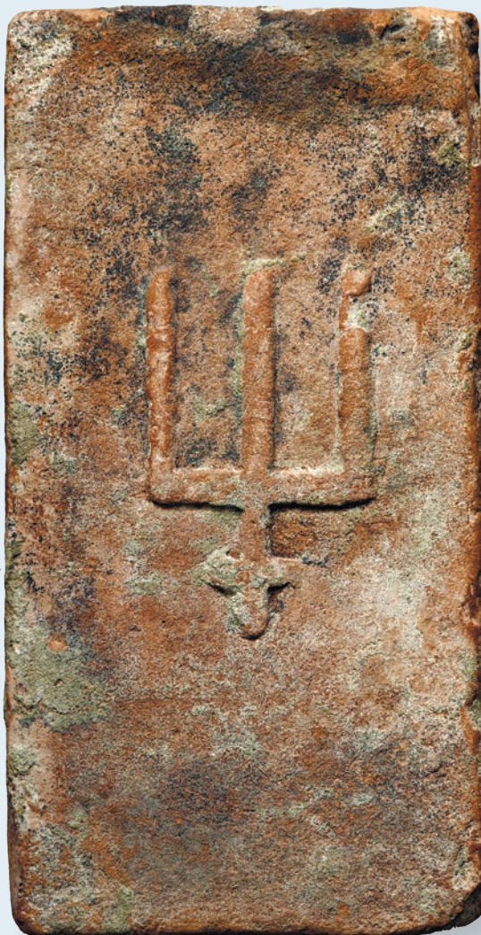
15. Цегла з тризубом Мстислава Даниловича. XIII ст.