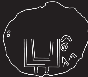
9. Печатка Святослава Хороброго