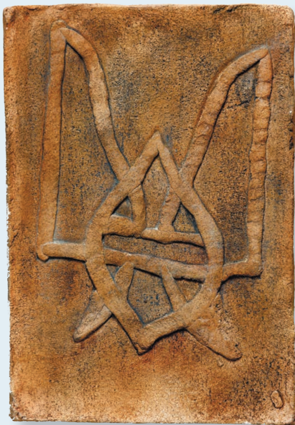
14. Копія плінфи з тризубом