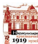
Комунальний заклад «Нікопольський краєзнавчий музей», м. Нікополь