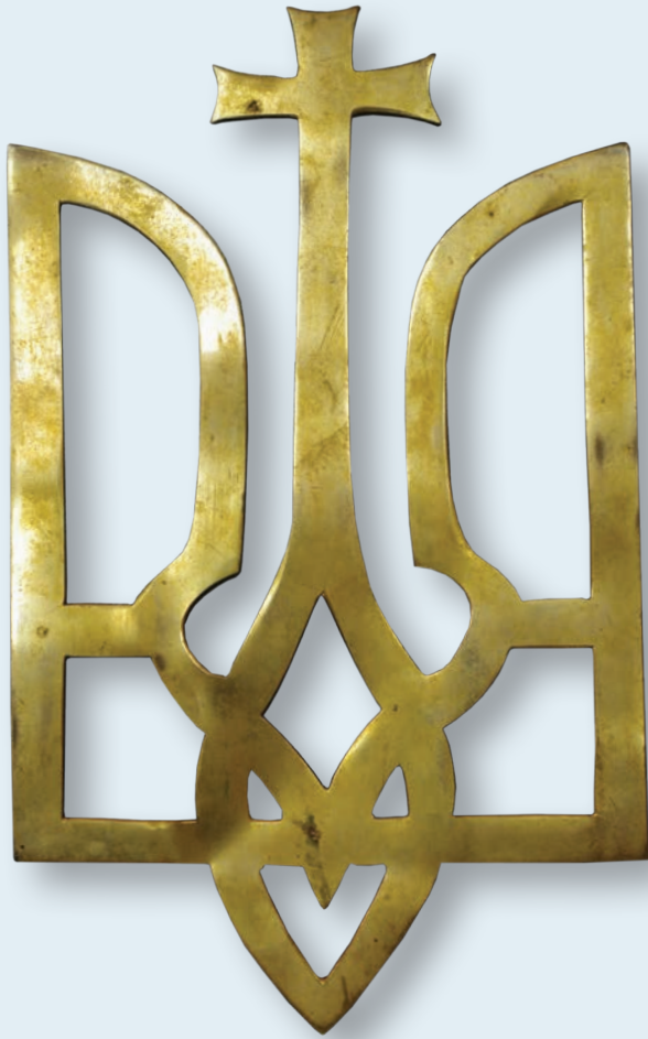
33. Металевий тризуб із хрестом на центральному зубі