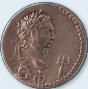
4. Статер Рескупоріда II 212/3 р.