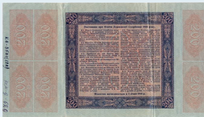
32. Білет Державної Скарбниці, номінал 200 гривень, серія V № 204664