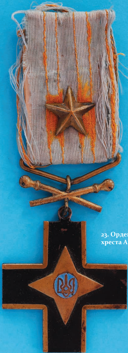
23. Орден лицарів Залізного хреста Армії УНР