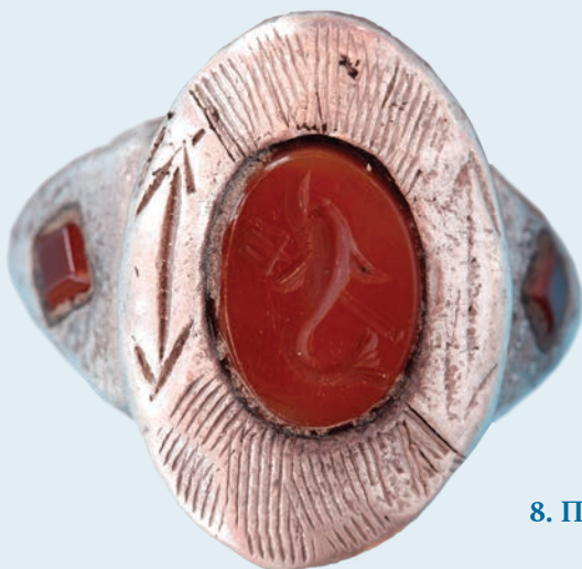
8. Перстень із сердоліковою вставкою V – VI ст.