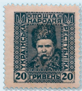
29. Марка поштова пошти УНР, номінал 20 гривень