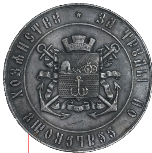
Нагородна медаль «За працю по сільському господарству»

трацію земель у руках селянської верхівки, яка перетворювалася на сільську буржуазію або фермерів, стимулювала зростання продуктивності сільського господарства, появу нових сільськогосподарських культур, покращення селекційної роботи, поглибила спеціалізацію регіонів, спричинила інтенсивніше використання сільськогосподарської техніки.