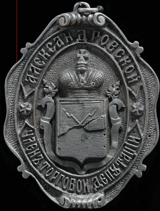
Знак члена Олександрівської торгової депутації

У зв'язку зі стрімким зростанням промислового виробництва краю в кінці XIX – на початку XX ст. розвивалися торгова та фінансова галузі регіону. Традиційно проводилися ярмарки, діяли базари, все більше відкривалося магазинів, кав'ярень та трактирів.