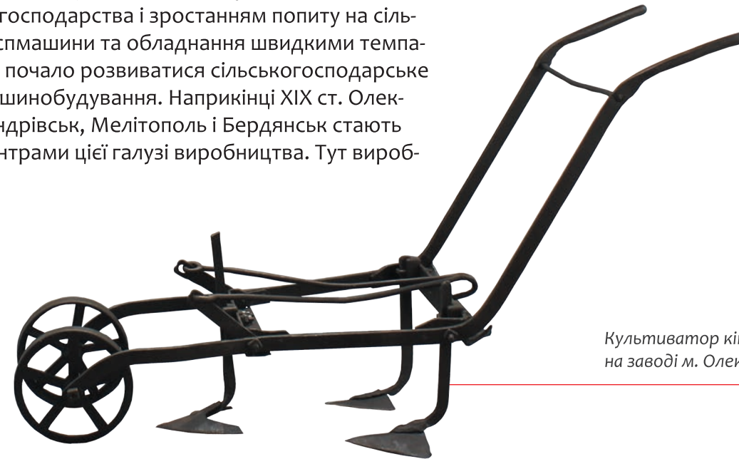
Культиватор кінця XIX ст., вироблений на заводі м. Олександрівська

У зв'язку з інтенсивним розвитком сільськогосподарства і зростанням попиту на сільгоспмашини та обладнання швидкими темпами почало розвиватися сільськогосподарське машинобудування. Наприкінці XIX ст. Олександрівськ, Мелітополь і Бердянськ стають центрами цієї галузі виробництва. Тут вироб-